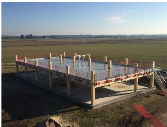
La structure Arbopark en cours de construction

Actuellement et depuis quelques mois, préparation d'un essai de résistance au feu en conditions réelles (maquette échelle 1) pour l'évaluation d'un parking à ossature bois (ARBOPARK).