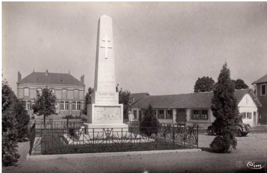
A droite la salle socio