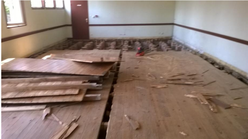
Les travaux de démontage