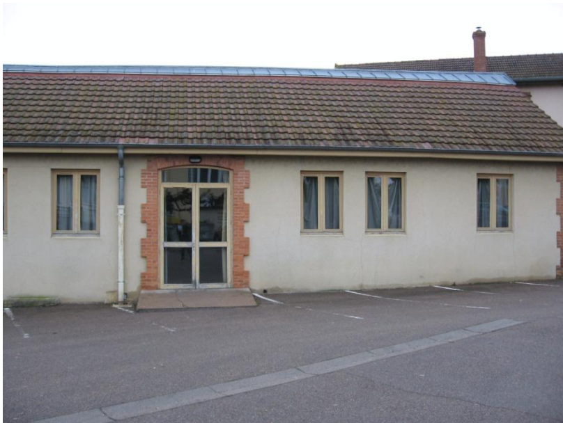
Extérieur avant travaux