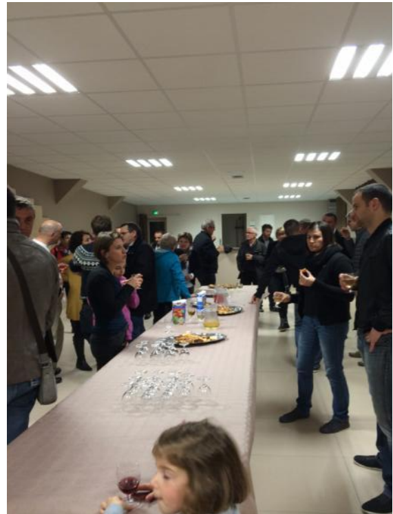
Inauguration du 20 septembre