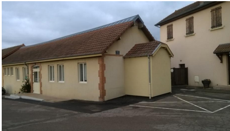
L'aménagement pour personnes handicapés